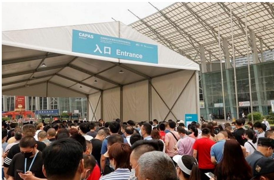
为期三天的展会共吸引 16,835 名入场观众

法兰克福展览（上海）有限公司副总经理于光先生对本届展会所取得的成绩表示满意：“今年 CAPAS 迎来了第七届，展会经过多年的历练和发展，不断迈向壮大和成熟，离不开各方一直以来的大力支持。本届展会联动多方，以成渝双城经济圈战略为重点方向，提供线上线下各类活动，通力搭建西南汽车行业优质服务平台，为业界同仁收集行业信息、建立业务网络的同时，也积极把西南汽车产业集群发展推至新高度。”